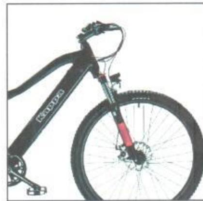
Cerchi in lega KMC